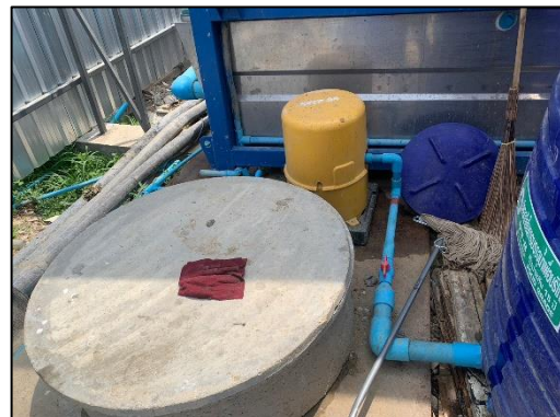
รูปที่ 43 บ่อเกรอะ