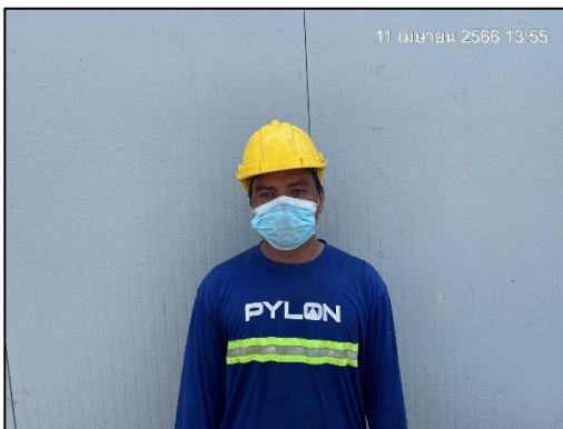
รูปที่ 40 เสื้อผ้าชุดปฏิบัติงาน