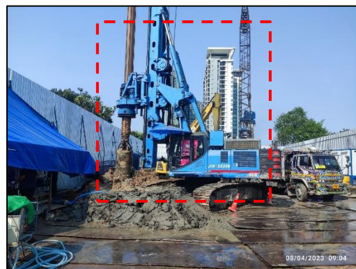
รูปที่ 41 เครื่องแบบปั๊ม