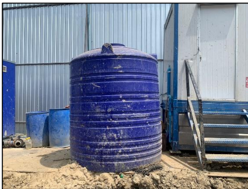
รูปที่ 42 ถังน้ำใช้